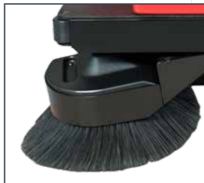
BRACCIO LATERALE SINISTRO LEFT SIDE BRUSH ARM BRAZO LATERAL IZQUIERDO