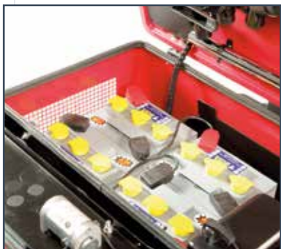
6 BATTERIE 6V-270 Ah (20h) - (E) 6 BATERÍAS 6 V-270 Ah (20h) - (E) 6 BATTERIES 6 V-270 Ah (20h) - (E)