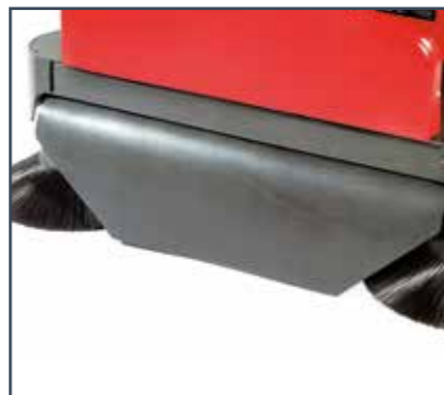
CONVOGLIATORE POLVERE ENCAMINADOR DE POLVO CONVOYEUR DE POUSSIÈRE