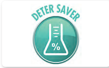
Dosatore detergente on board On board detergent dosing system Dosificación detergente a bordo