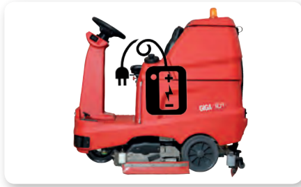
Carica batteria on board On-board battery charger Cargador de batería incorporado