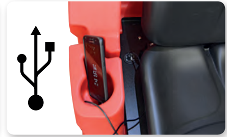
Porta USB USB port Puerto USB